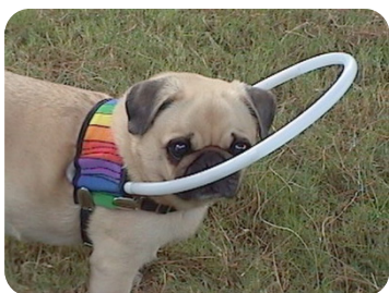
Système de protection pour chien aveugle

Après la perte de la vision chez votre animal, il y a une période d'adaptation et d'ajustement où vous devrez suivre plusieurs consignes afin qu'il demeure en sécurité. Les animaux aveugles vont utiliser leurs autres sens (l'ouïe, l'odorat, le toucher), ce qui rendra la perte de la vision bien moins traumatique que chez l'homme. En général, les animaux s'adaptent très bien surtout si la perte de vision fut progressive.